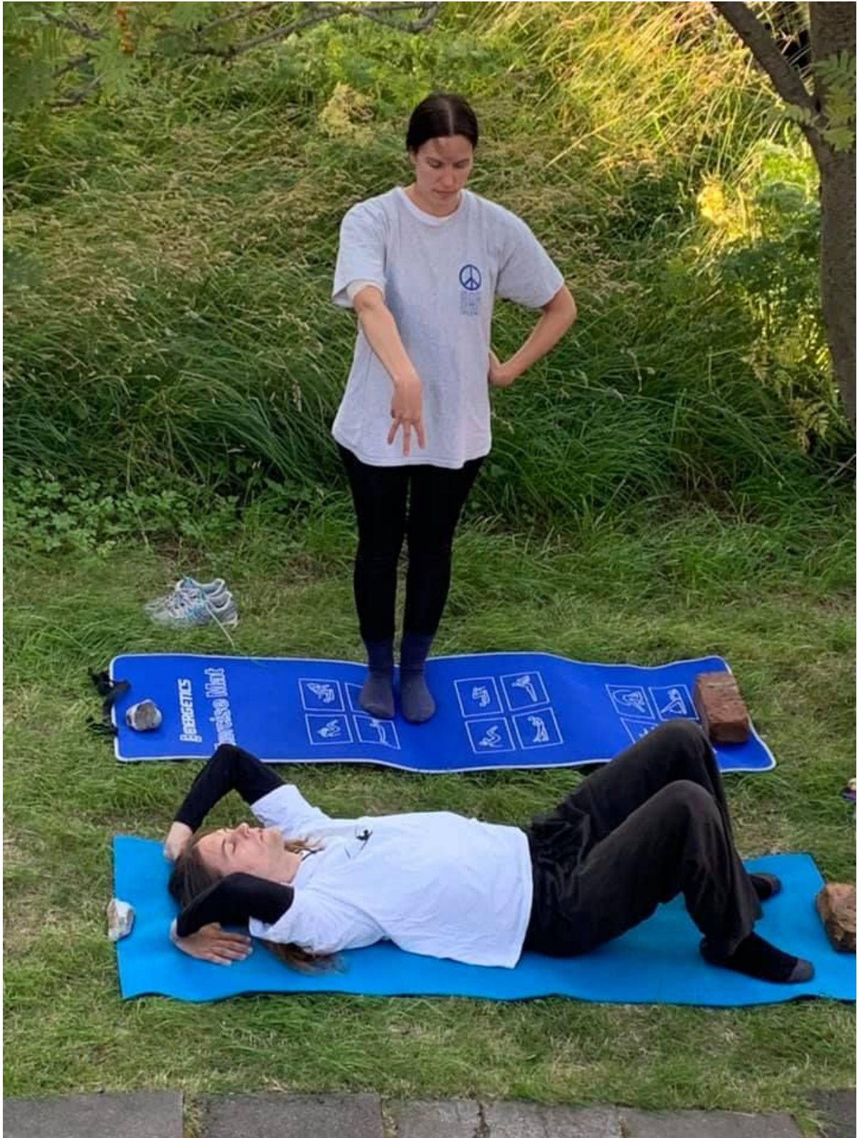
Listamenn frá Noregi fremja gjörning byggðan rúna-jóga, meðfram sýningu sinni í Ekkisens.