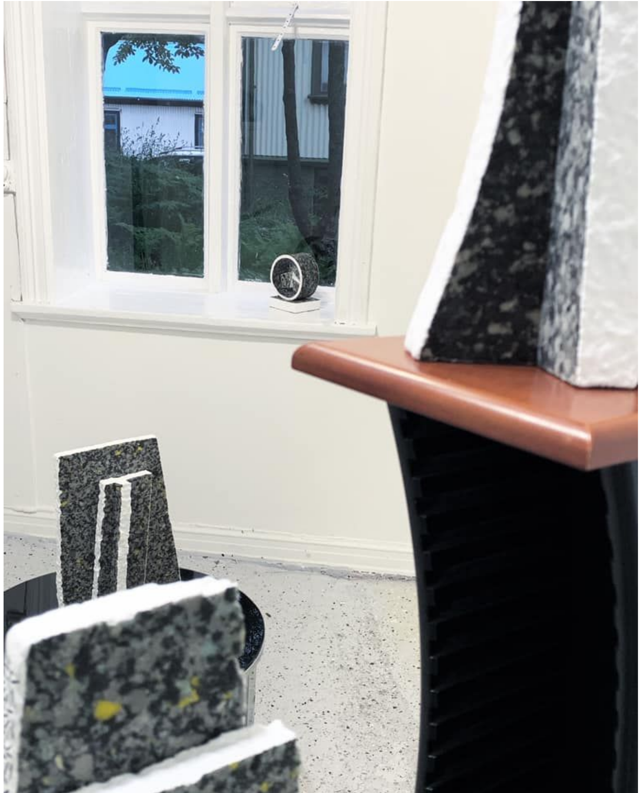
Mjúkberg, sýning á skúlpúverkum Söru Bjargar, svokallaðar framtíðarbergtegundir