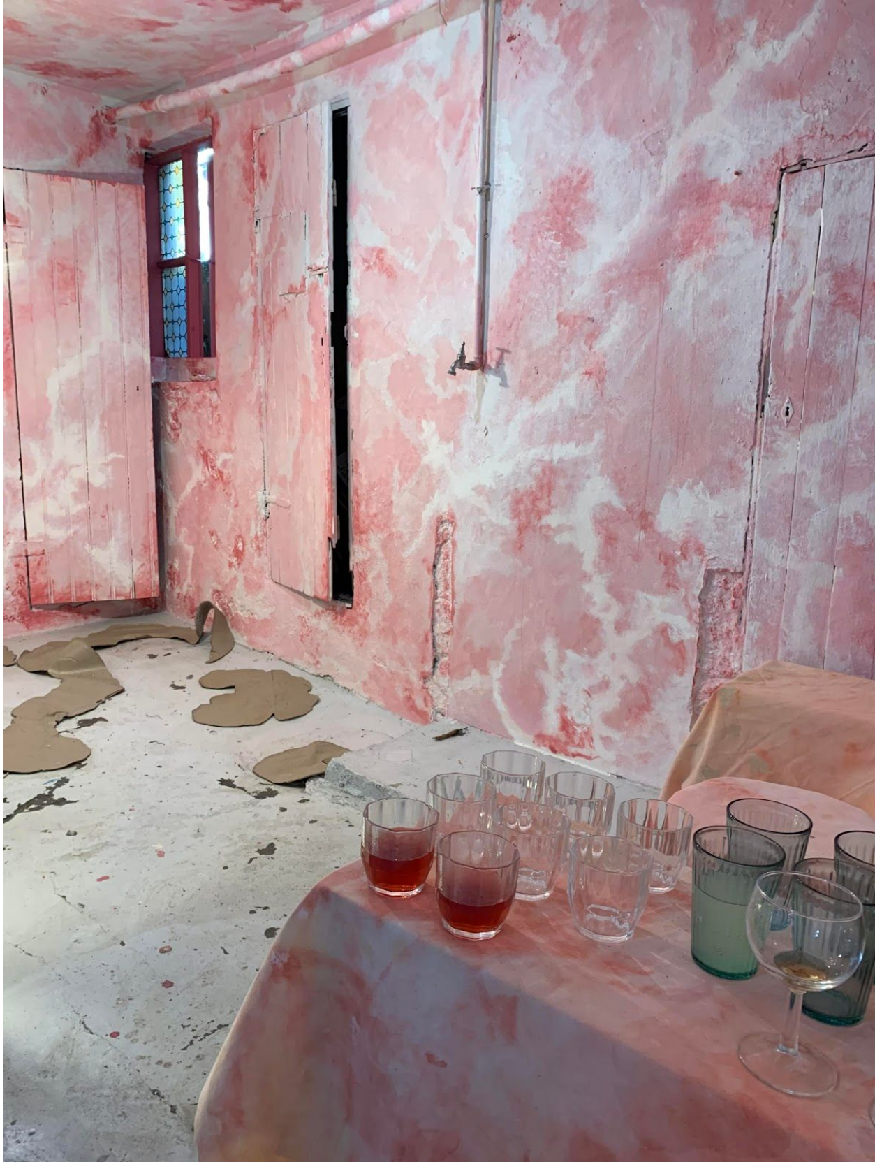
Holdrýmið, þar sem boðið er upp á veitingar á opnun sýninga og viðburða.